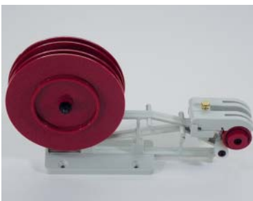
36 141 00 INLAND Foliendispenser INLAND foiler