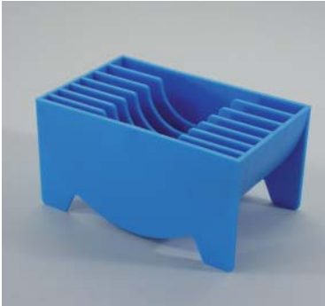
36 130 00 Folienbox für 7 Rollen mit unterschiedlichen Foil dispenser for 7 rolls with different sizes