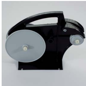
36 140 00 GLASTAR Foliendispenser GLASTAR foiler