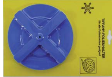
36 100 00 Folienhalter für 1 Rolle (alle Breiten) Foil holder for 1 roll (all sizes)

Der Foliendrucker drückt die aufgetragene Folie gleichzeitig auf beiden Seiten an. Sie schonen Ihre Fingernägel. Mit den Foliendispensern, die es für die gebräuchlichsten Foliendispenserbreiten gibt, wird die Kupferfolie schnell und präzise aufgetragen. Der Folienschutzstreifen löst sich automatisch. Die Abroller sind für die üblichen Glasstärken geeignet. Die Schablionenscheren sparen beim Schneiden einen schmalen Streifen aus, der dem Auftrag der Folie bzw. dem Blei entspricht. Dadurch wird vermieden, daß das Objekt größer als die Vorlage wird.