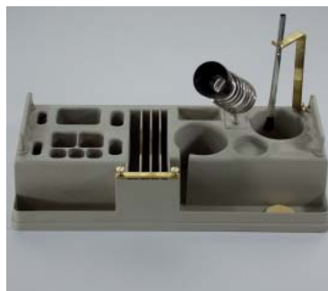
36 131 00 INLAND Glass-Station mit Lötkolbenhalter und vielen Ablagen für Werkzeug und Zubehör INLAND Glass Station with soldering iron stand and storage space for tools and accessories