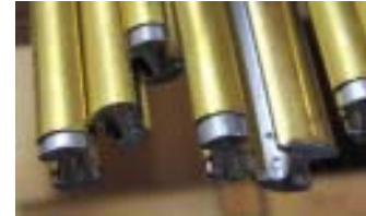
Messing- und Neusilber überzogene Sprossen werden durch Löten verbunden.

Diese Sprossen bestehen aus einem Bleikern, der mit dem entsprechenden Blech überzogen ist. Messing z.B. erhält mit der Zeit eine schöne Patina - es kann natürlich jederzeit mit feiner Stahlwolle wieder auf Hochglanz poliert werden. Bei Alugold ist Nachpolieren nicht möglich !