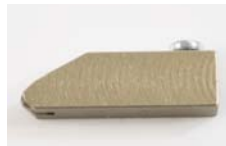
31 146 01 HM, SW 135° schmal / narrow