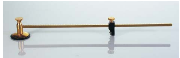
31 171 00 Rundschnneiderzirkel einfach 60 cm Circle cutter ordinary type 60 cm