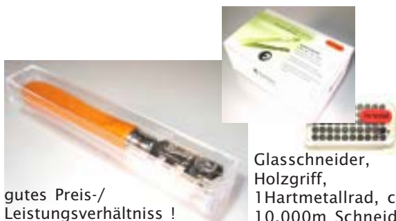
gutes Preis-/Leistungsverhältnis !