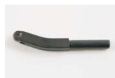
31 126 01 SW 120°, HM 31 126 02 SW 135°, HM 31 127 01 SW 120°, ST

Über unser Standardprogramm hinaus liefern wir Ihnen gerne auch andere Produkte aus dem Lieferprogramm der Firma Bohle. Sie können diese mit der Originalnummer von Bohle bestellen.