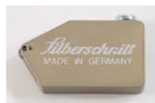
31 146 02 HM, SW 135° breit / wide