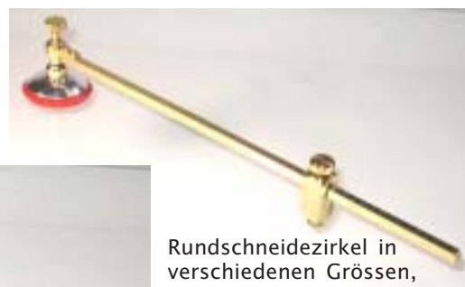
Rundschnidezirkel in verschiedenen Größen, ganz aus Messing, 6mm Hartmetallrad