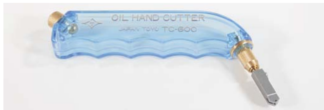
31 162 00 TC 600 Pistolengriff klar, schmaler Kopf pistol grip clear, narrow head