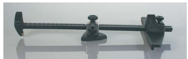
31 190 00 Rund- und Streifenschnneider, Kunststoff Circle and stripe cutter, plastic