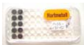
5mm Hartmetallrad. ca 50.000m Schneidleistung