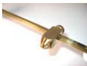
Schneidkopf, ganz aus Messing, 6mm Hartmetallrad, ca 60.000m Schneidleistung