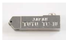
31 160 01 schmal / narrow

ERSATZKÖPFE für alle TOYO-Modelle REPLACEMENT HEADS for all TOYO cutters