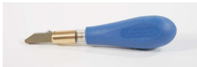
31 044 00 Ölglasschneider / Oil glass cutter 444.0 SW 120°, HM, schmaler Schneidkopf, Kunststoff-Schaft / narrow head, plastic grip