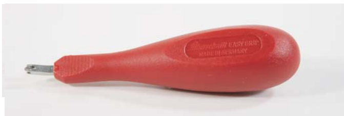
31 127 00 Easy Grip 128.01 SW 120°, ST, mit Gleitschuh / with sliding block