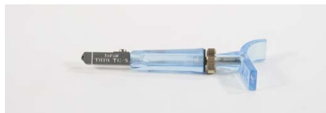
31 163 00 TC 9P Thomas Grip Rainbow schmaler Kopf / narrow head Schaft neonfarben / neon colored grip

ERSATZKÖPFE für alle TOYO-Modelle REPLACEMENT HEADS for all TOYO cutters