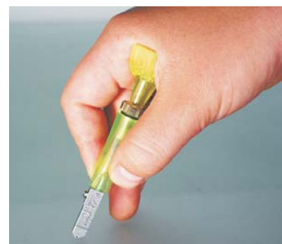
Handhaltung beim TOYO TC 9P Hand position with the TOYO TC 9P

All Toyo glass cutters have a cutting angle of 134°.