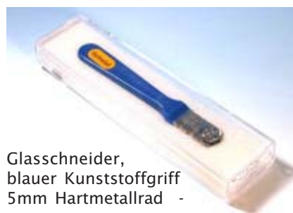
Glasschneider, blauer Kunststoffgriff 5mm Hartmetallrad -