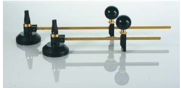
Rundschnneider mit Saugnapf und Griffkugel Circle cutter with suction cup and grip knob