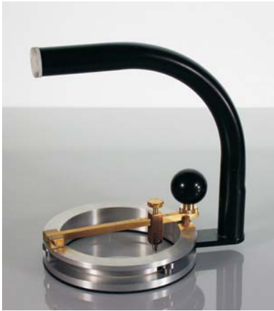
31 170 00 Rundschnneider 533.0 für Kreise bis 9 cm Cutter 533.0 for circles up to 9 cm