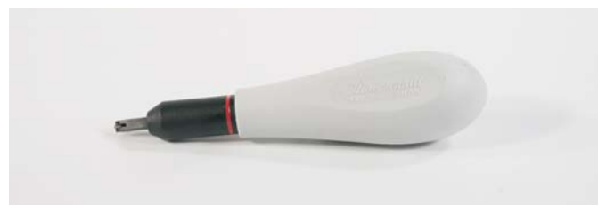
31 125 00 Hobby Long Life 424.0 SW 120°, HM, Längenverstellbarer Kunststoff-Schaft / Adjustable length plastic shaft