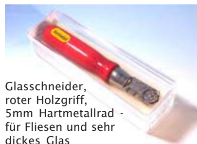
Glasschneider, roter Holzgriff, 5mm Hartmetallrad - für Fliesen und sehr dickes Glas