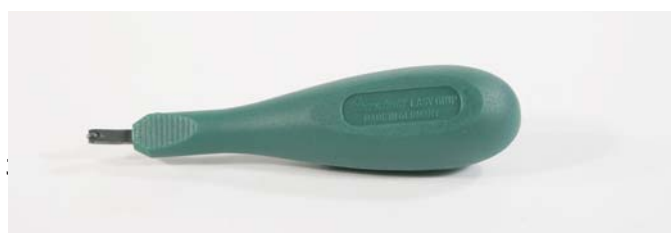
31 128 00 Easy Grip 428.0 SW 120°, HM, mit Gleitschuh / with sliding block