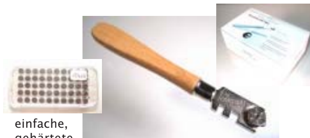
einfache, gehärtete Stahlrädchen in 50St. Box