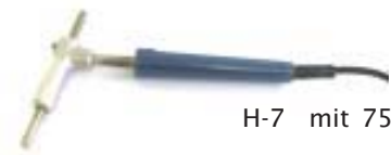
H-7 mit 75 Watt

H-15-T mit 600 Watt - für Arbeiten mit extrem hohem Wärmebedarf bei gleichzeitiger Temperaturbegrenzung.