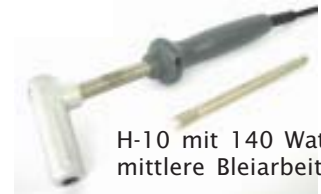
H-10 mit 140 Watt für mittlere Bleiarbeiten