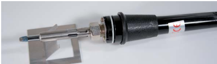
34 180 00 INLAND LötKolben mit Keramikelement / INLAND soldering iron, with ceramic element