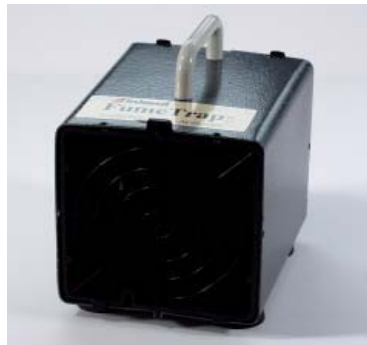
36 472 00 Absauganlage / Soldering fume absorber / 220 V / 15 Watt