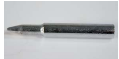
34 180 01 INLAND Ersatzspitze 1/4" INLAND replacement tip 1/4"