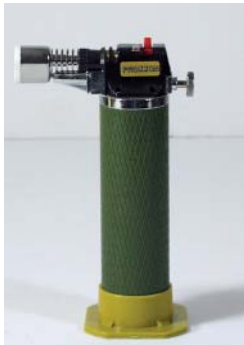
34 301 00 MICROFLAM GaslötKolben MICROFLAM gas soldering iron