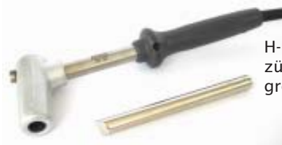
H-15 mit 180 Watt für zügiges Arbeiten an großen Blei-Feldern