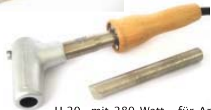
H-20 mit 280 Watt - für Arbeiten mit hohem Energiebedarf