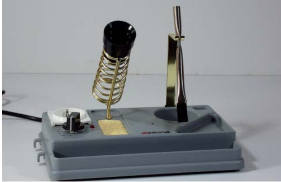
36 132 00 INLAND Lötstation mit Halter für LötKolben und Pinsel, Ablage und LötKolbenregelung INLAND soldering station with stand for iron and brush, additional storage and temperature control