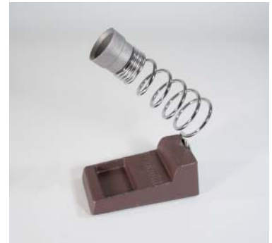
34 145 00 LötKolbenständer Soldering iron stand