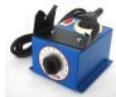
Zeva-BGR. Ablage mit Leistungssteller (Hysterese frei)

Die ideale Kombination für die Bleiwerkstatt: H-15 mit Ablage / Leistungssteller