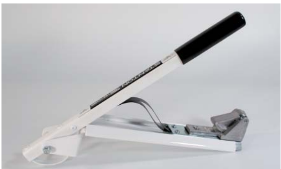
36 301 00 GLASTAR Blei-Strecker GLASTAR lead stretcher