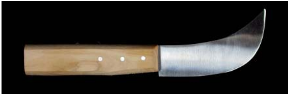
36 306 00 Bleimesser mit Sichel-Klinge Lead knife with banana blade