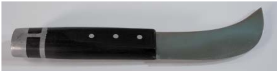
36 310 00 Bleimesser mit mit Bleianguß Lead knife with lead end