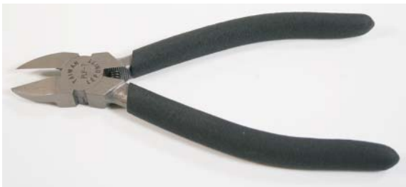
32 170 00 Blei-Seitenschneider Lead came cutter