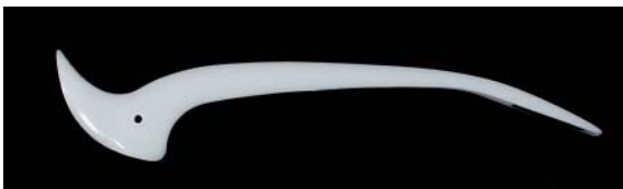
36 155 00 Bleiaufreiber und Andrücker, Kunststoff Lead burnisher, plastic