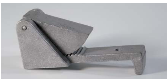
36 300 00 Blei-Strecker / Aluminium, mit Feder Lead stretcher / aluminum, with spring