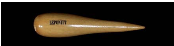
36 156 00 Bleiaufreiber aus Holz Lead burnisher, wooden