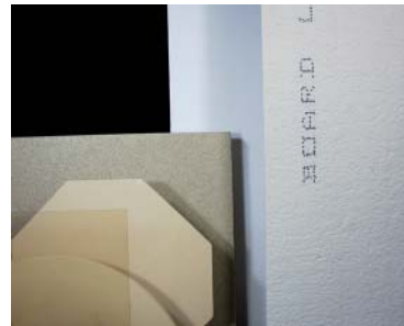
Ofenplatten / Kiln plates