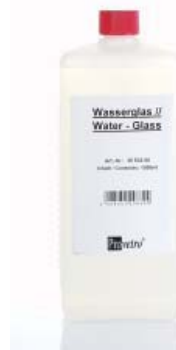
35 532 00 Wasserglas / Waterglass

PV-Nucleus wird ebenfalls zunächst nachgemischt und anschließend mit ca. 400 cm 3 Wasser für 1 kg Formenmasse aufbereitet. Nach dem Trocknen zusammen mit der Außenform (Hydracast) totbrennen. Das Nucleus-Material ist nach der Schmelze und dem Entspannen leicht mit einem Wasserstrahl zu entfernen.