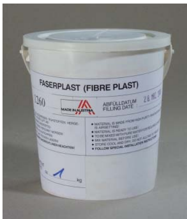
35 526 00 Faserplast / Fiber Plast Mold, 1260° C