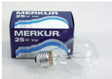
Normal-Glühbirne, E27, klar Normal bulb, E27, clear 66 100 02 25 Watt 66 100 03 40 Watt 66 100 04 60 Watt