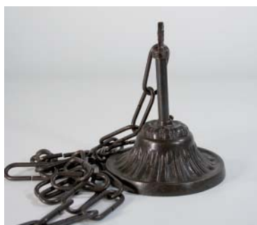
Kettenpendel ART DECO 3, bronze Canopy & chain ART DECO 3, bronze