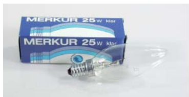
Kerzen-Glühbirne, E14, klar Candle bulb, E14, clear 66 210 02 25 Watt 66 210 03 40 Watt 66 210 04 60 Watt