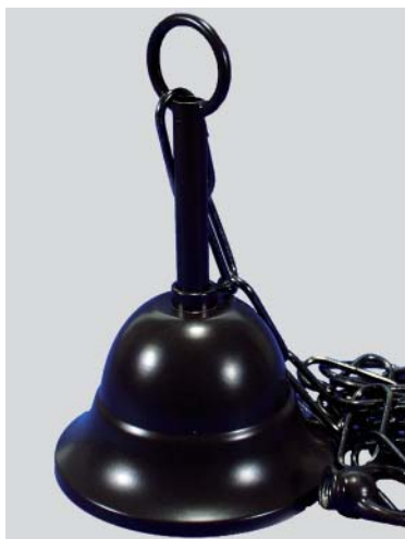
23 212 01 Kettenpendel, konisch, Brüniert Canopy with chain, brown