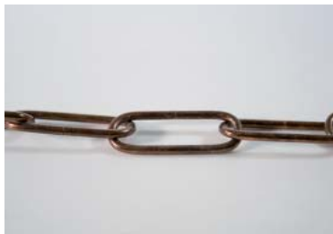
Lampenkette, 30 mm, 20 m Lamp chain, 30 mm, 20 m 23 133 00 Messing / brass 23 133 01 Braun / brown 23 133 02 Schwarz / black