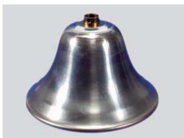
Baldachin, Messing / Canopy, brass 23 101 00 d: 80 mm