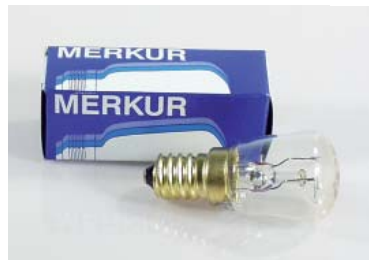
Birnen-Glühbirne, E14, klar Pear bulb, E14, clear 66 220 01 15 Watt