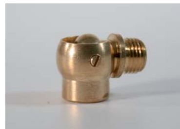
24 260 00 Messing-Kugelgelenk mit Flügel-schraube Swivel with thumb screw, brass