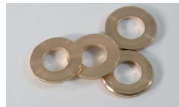
24 318 00 Unterlegscheibe, messing Plain washer, brass, 20 x 10 mm