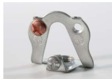
23 201 00 Aufhänger für Pendelrohr Hook for cluster pipes