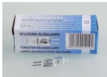
Halogenstift, G4 / Halogen bulb G4 65 200 01 20 Watt 65 200 05 5 Watt 65 200 06 10 Watt