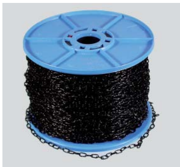
Bilderkette, Rolle = 25 m Small chain, roll = 25 m 23 150 00 Bleifarben / lead color 23 150 01 Brüniert / brown 23 150 02 Schwarz / black