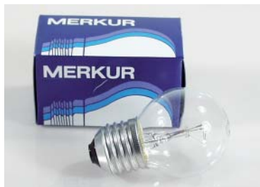
Tropfen-Glühbirne, E27, klar Drop bulb, E27, clear 66 110 02 25 Watt 66 110 03 40 Watt