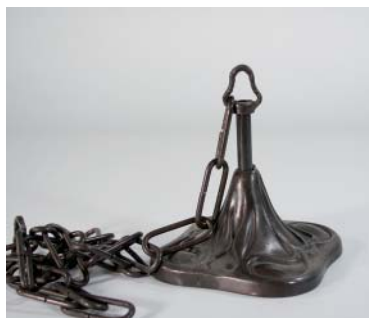
Kettenpendel JUGENDSTIL, Bronze Canopy & chain JUGENDSTIL, bronze 23 213 01