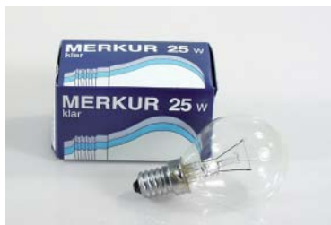
Tropfen-Glühbirne, E14, klar Drop bulb, E14, clear 66 200 02 25 Watt 66 200 03 40 Watt